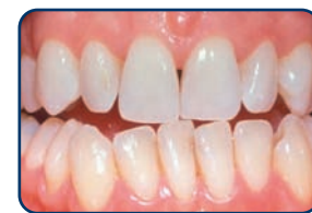
Resultaat na tien dagen bleken met de thuisbleekmethode onder begeleiding van de tandarts