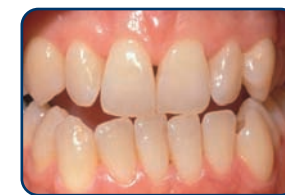
Voor het bleken

De lengte van een bleekbehandeling hangt af van de bleekmethode. Bij de thuisbleekmethode duurt het meestal twee weken voordat u een gewenst resultaat bereikt.